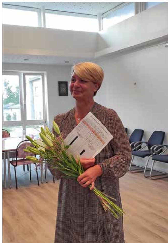
Bürgermeisterin Beatrix Wilke