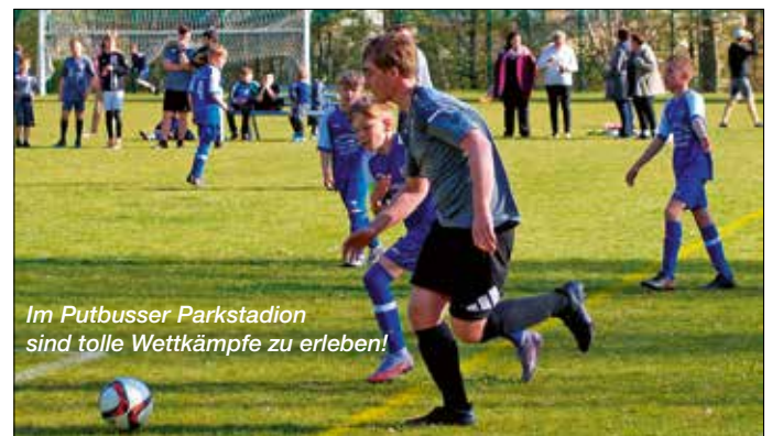
Im Putbusser Parkstadion sind tolle Wettkämpfe zu erleben!