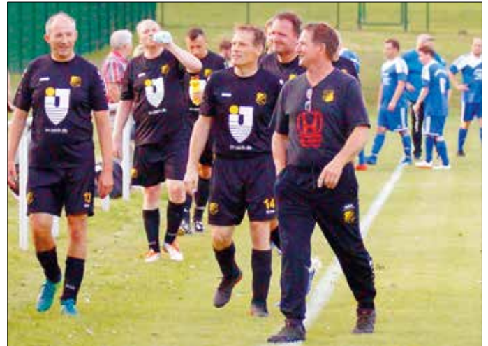
Tolle Stimmung bei unseren Fußballern im erneuerten Parkstadion.