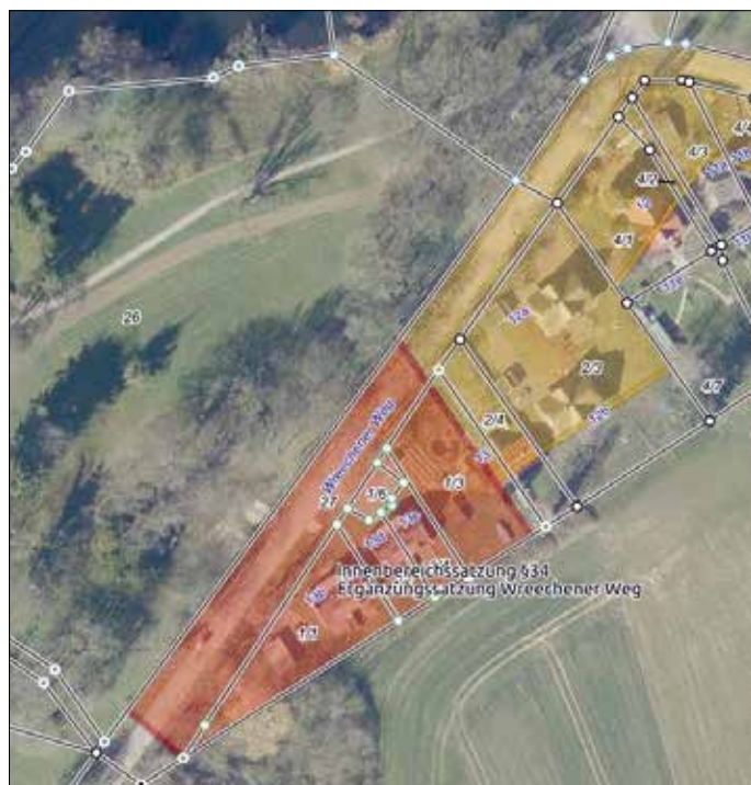
Luftbild mit Geltungsbereich der Planung (unmaßstäblich)

Die 1. Änderung der Ergänzungssatzung gemäß § 34 Abs. 4 Nr. 3 BauGB „Wreechener Weg“ der Stadt Putbus mit örtlichen Bauvorschriften ist für den nachfolgend grafisch dargestellten Bereich, in der Ortslage Putbus, Wreechener Weg, in Kraft getreten. Der betroffene Bereich erstreckt sich auf die in der Karte dargestellten Flurstücke, der Flur 6, Gemarkung Putbus.