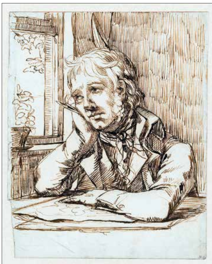
Selbstbildnis mit aufgestütztem Arm (um 1802) Hamburger Kunsthalle