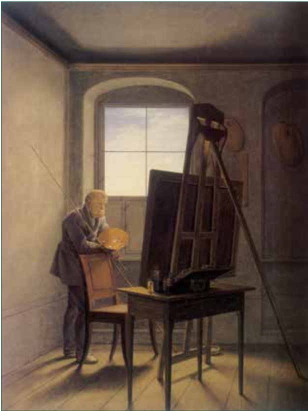
Georg Friedrich Kersting Der Maler Caspar David Friedrich in seinem Atelier, 1819