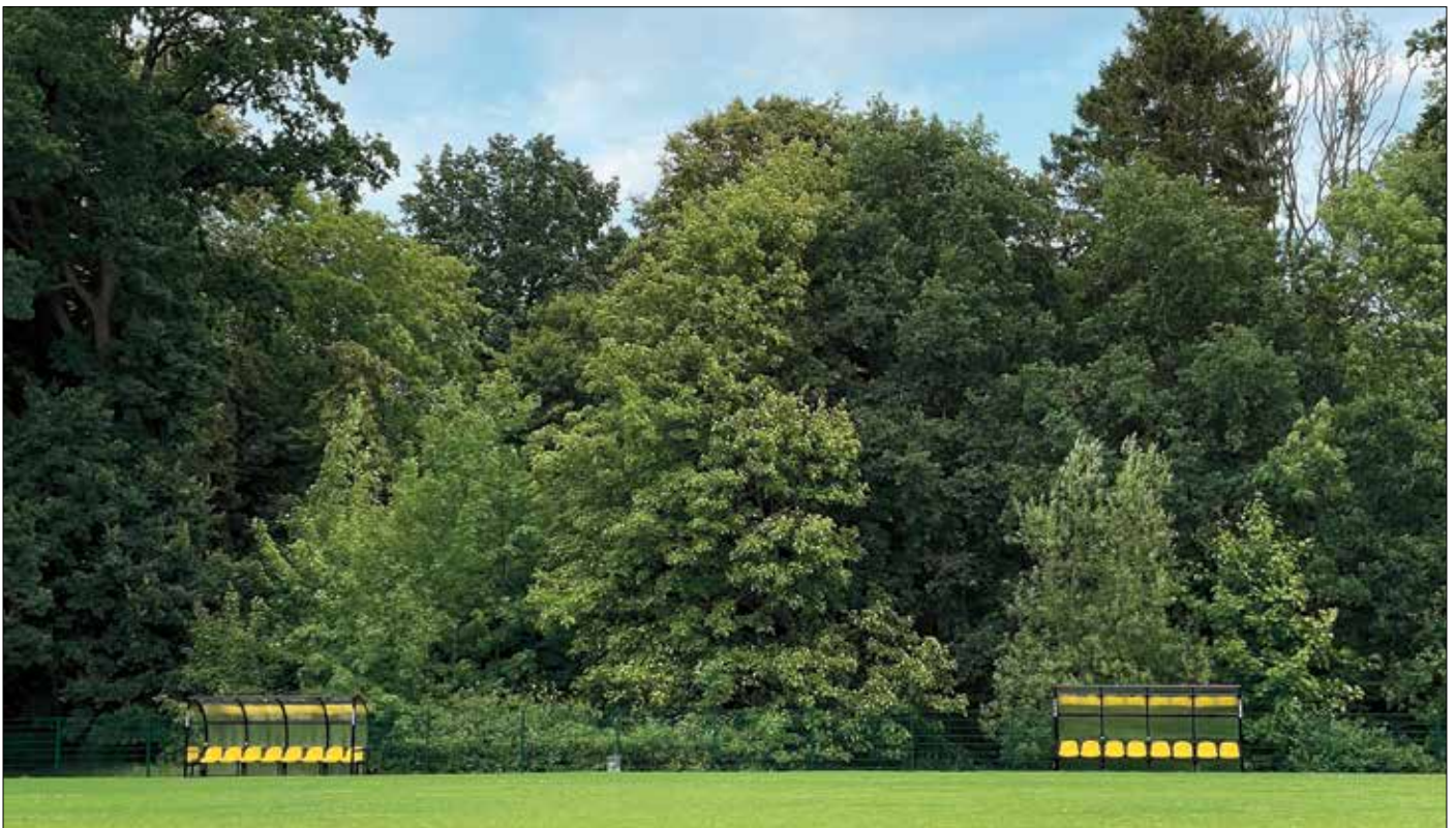
Unsere schmucken Spielerkabinen in den Vereinsfarben schwarz/gelb.

Nach einer umfassenden Renovierung wurde unser Sportplatz im Juni 2021 offiziell von der Stadt Putbus freigegeben und danach im Laufe der Zeit weiterentwickelt – größtenteils durch engagierte Vereinsmitglieder. Darunter ein Anbau am Vereinsheim mit Schiedsrichterraum und Gästetoiletten. Der Fußballplatz verfügt nun über eine digitale Anzeigetafel und zwei moderne Spielerkabinen. Drei Junioren-Teams haben sich unserer Altherren-Mannschaft (Ü35) seit 2021 angeschlossen, trainieren