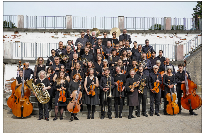
Das Rügener Inselorchester beim Sommerprojekt 2023

Wer die Arbeit des Vereins unterstützen möchte, kann dies mit einer Spende auf das Vereinskonto (IBAN: DE15 1505 0500 0102 1200 48) und natürlich mit einem Konzertbesuch tun. Weitere Infos unter www.inselorchester.de