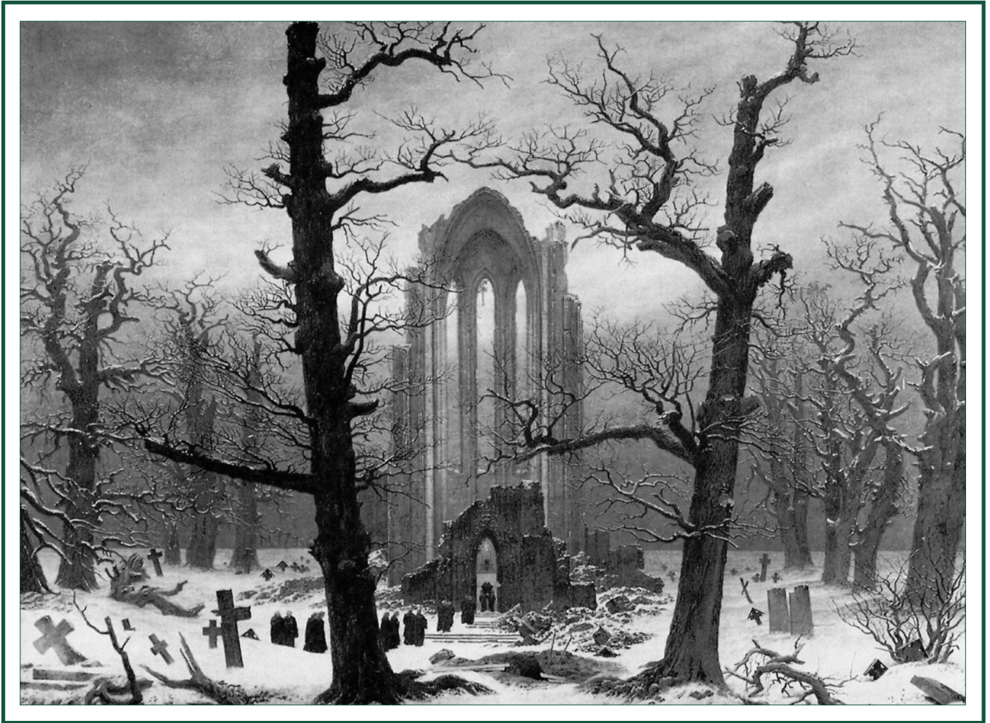
Klosterfriedhof im Schnee, 1819