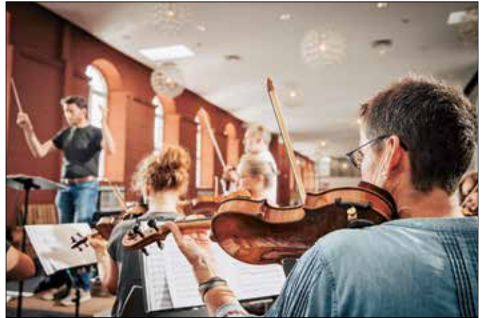
Das Rügener Inselorchester im Jahr 2024.