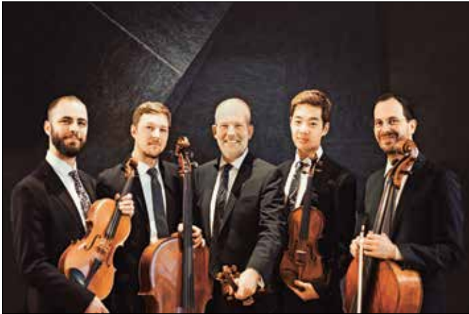
Das Frielinghaus Ensemble wird im Marstall zu Gast sein.